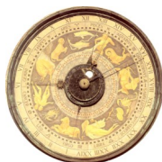
Ordine degli Ingegneri